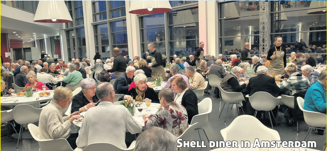
SHELL diner in Amsterdam

De PlusBus biedt ouderen begeleiding en vervoer naar winkels, voorzieningen en diverse activiteiten.